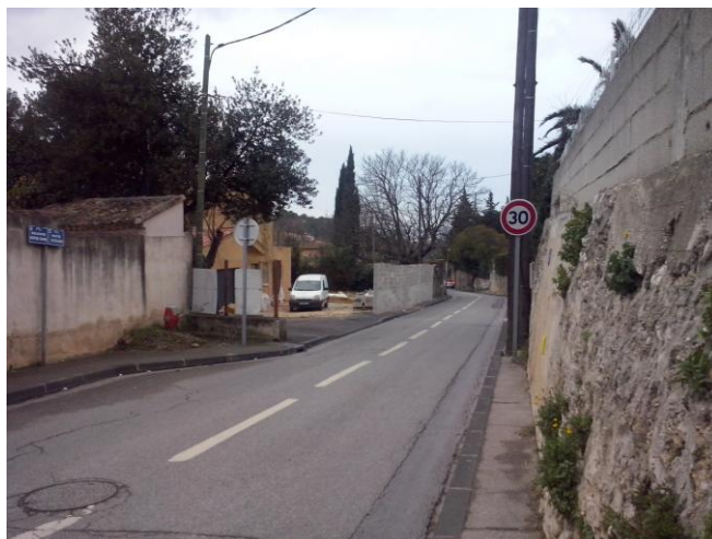
84 montée d'Eoures - 28/02/2014 (2)