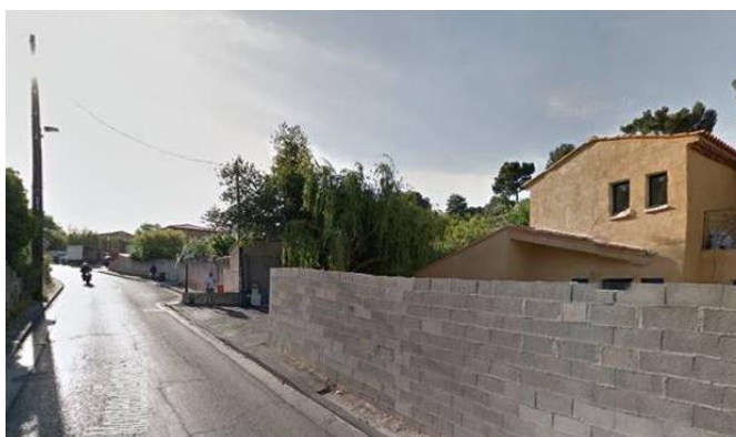
84 montée d'Eoures - 28/02/2014 (3)