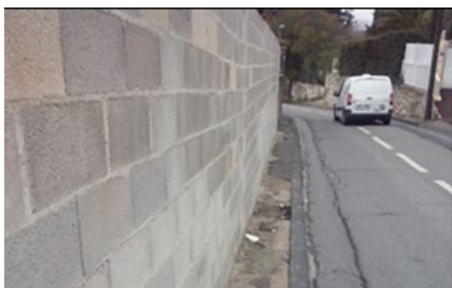
84 montée d'Eoures - 28/02/2014 (4)

Par la présente, nous vous demandons de faire appliquer le PLU et de prononcer la déconstruction pure et simple de ce mur .