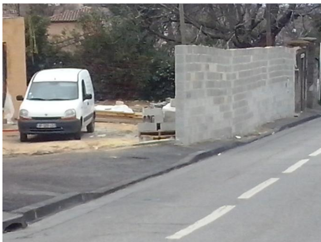
84 montée d'Eoures - 28/02/2014 (1)