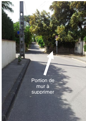
Bld des cigales direction sud