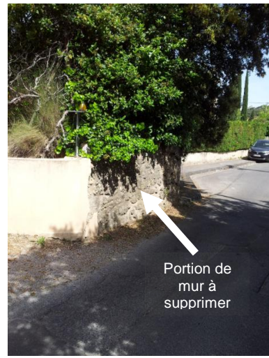
Bld des cigales direction nord